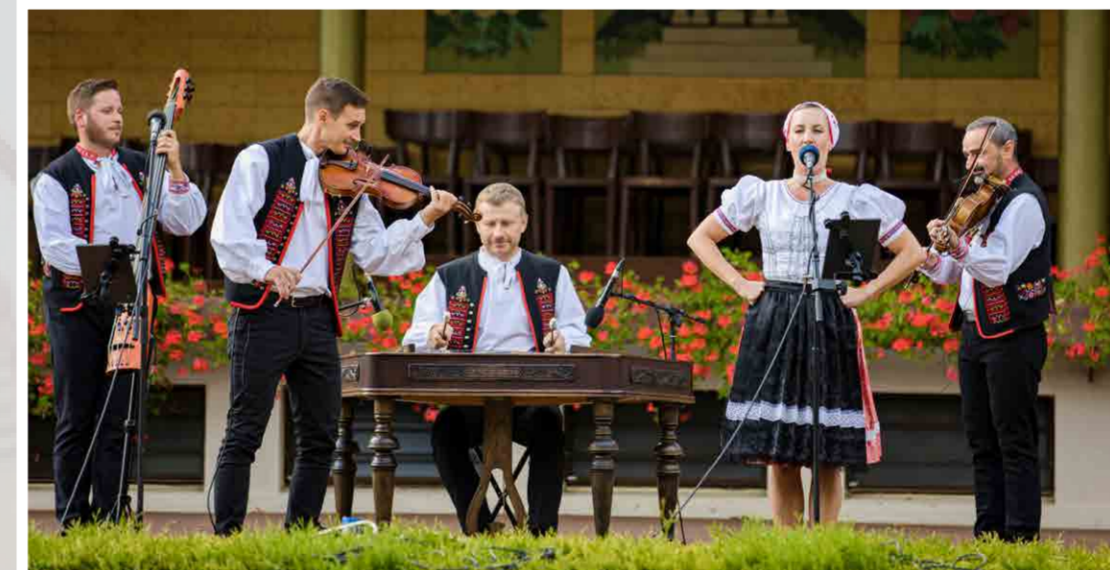
Ke Dnům slovenské kultury patří neodmyslitelně také slovenský folklór, který na Lázeňském náměstí představili Fidlikanti z Bratislavy (2. září 2022)