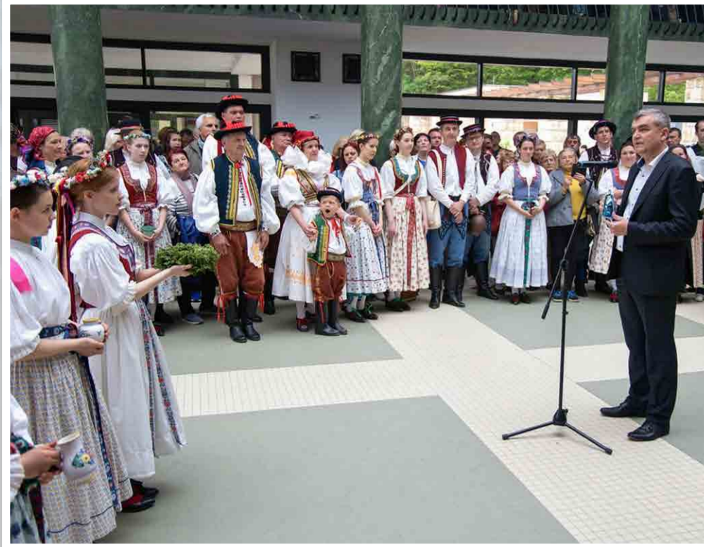
Generální ředitel Lázní Luhačovice, a. s. symbolicky zahajuje lázeňskou sezónu v hale Vincentka při Otevírání pramenů (8. května 2022)