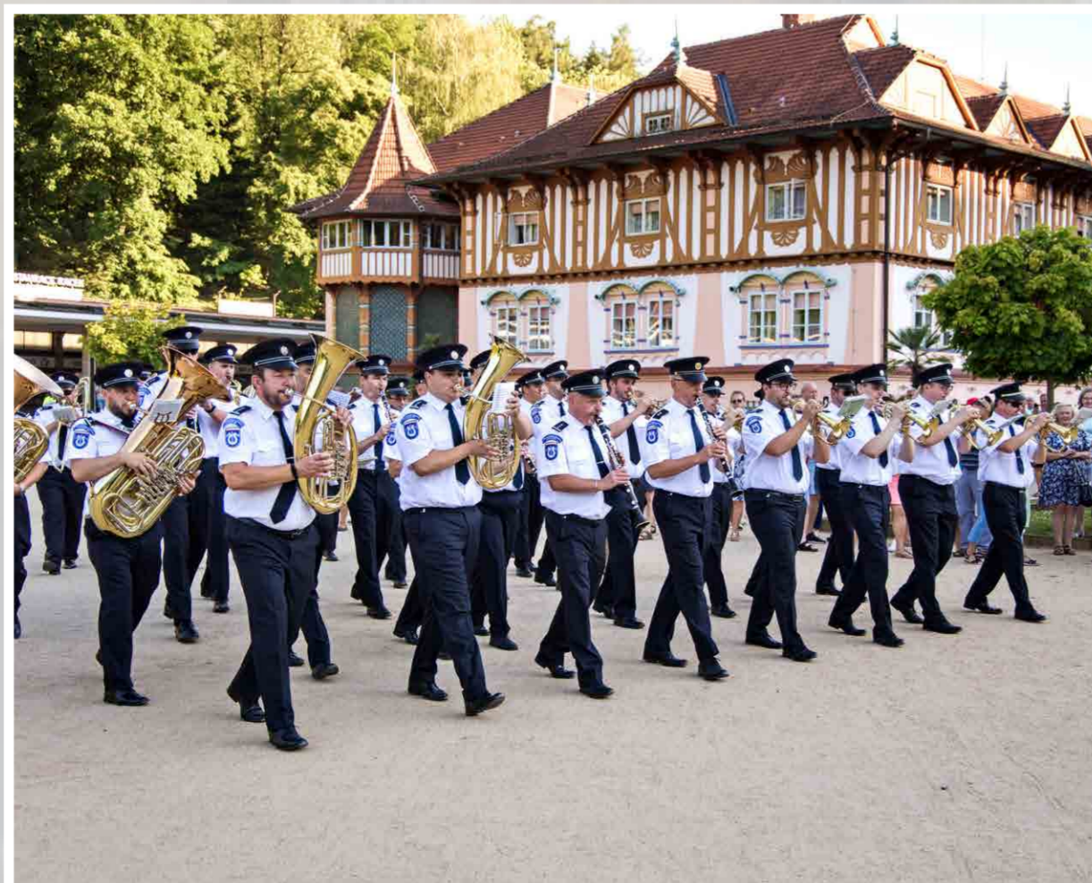
Hudba Hradní stráže a Policie ČR přichází před kolonádním koncertem na Lázeňské náměstí (23. června 2022)