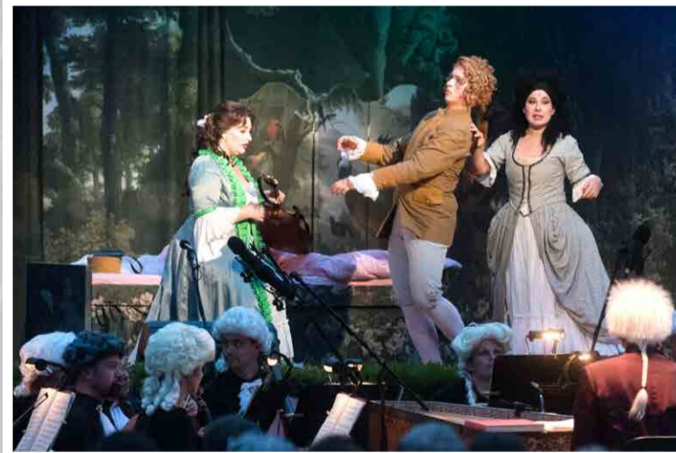
Ozdobou 29. ročníku Festivalu Janáček a Luhačovice byla Mozartova Figarova svatba provedená Slezským divadlem Opava na Lázeňském náměstí (11. července 2022)