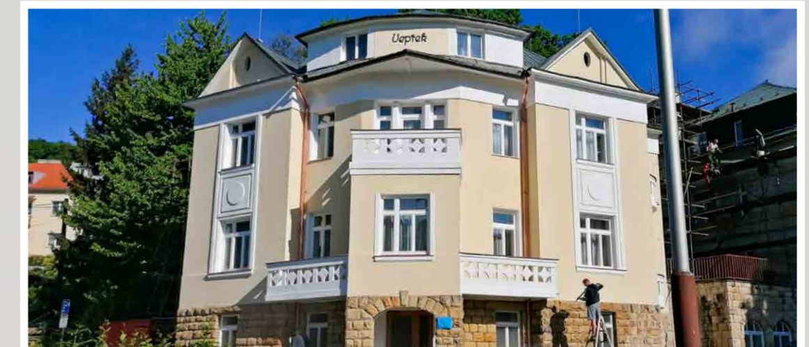
Novotou září po obnově fasády také penziony Vepřek a Póla