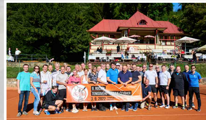
Na lázeňských tenisových dvorcích, které hostily v roce 1932 dokonce i slavný Davis Cup, proběhl 9. ročník turnaje osobností (3. září 2022)