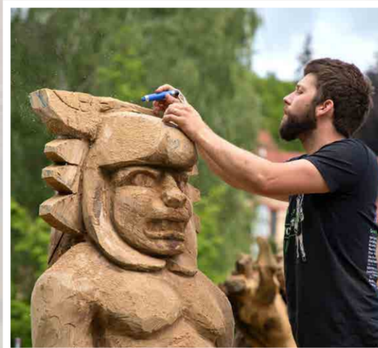
Po dvouleté přestávce se do lázeňského parku vrátili mistři řezbáři (Řezbářské sympozium 6.–11. června 2022)