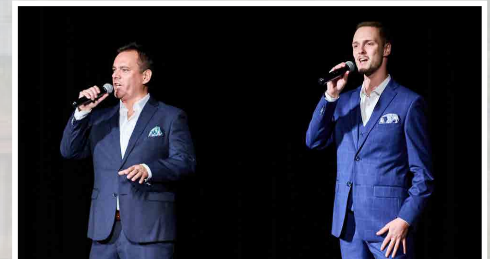
10. ročník Dnů slovenské kultury uzavřel koncert operního dua Gioia (3. září 2022)