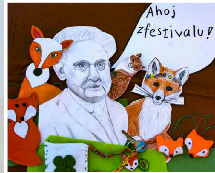
Koláž, kterou vytvořily děti během workshopu Dobrodružství lišky Bystroušky (Festival Janáček a Luhačovice, 11.–15. července 2022)