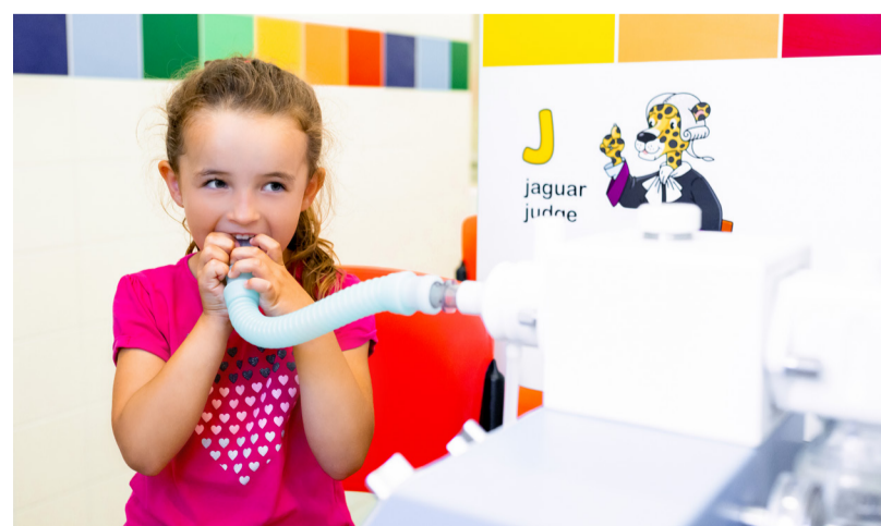
Inhalační léčbu zvládají bez problémů i malé děti od 1,5 roku