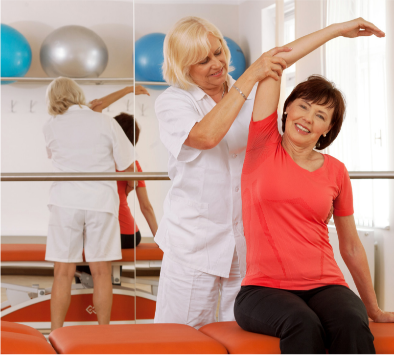
Součástí lázeňské léčby je i rehabilitace