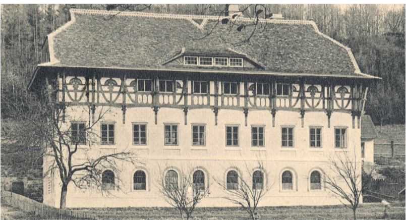
Vodoléčebný ústav krátce po dokončení