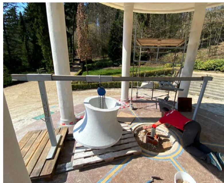
Oblíbený pramen Ottovka dostal novou pramení vázu

Jeden z nejoblíbenějších luhačovických pramenů prošel před začátkem hlavní sezony rekonstrukcí.