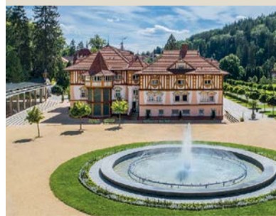
hotel Jurkovičův dům*** – dominanta Luhačovic