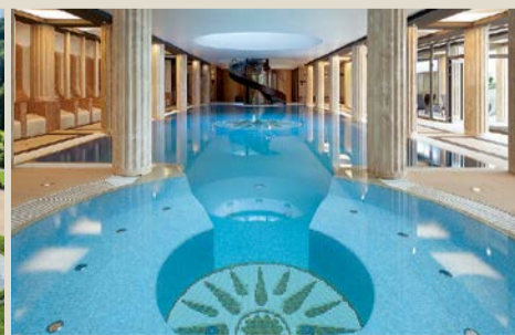
wellness ve stylu starořímských lázní