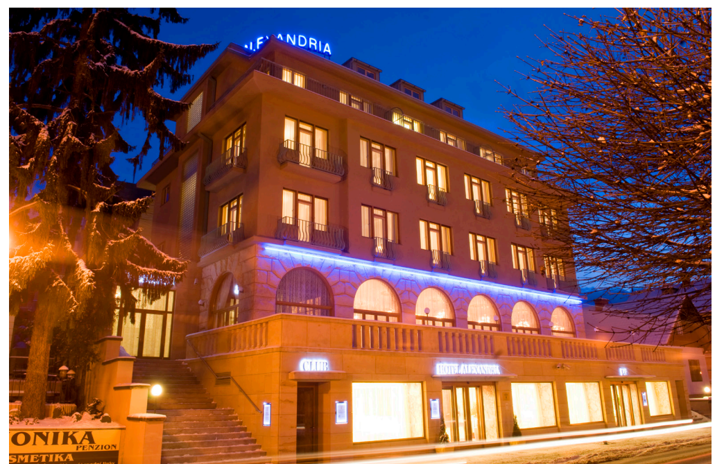
Hotel Alexandria má svou atmosféru v každém ročním období

Alexandria je reprezentativní pětipodlažní hotel v monumentálním klasicizujícím stylu. Svě první hosty hotel přivítal v roce 1939. Tehdejší tisk považoval stavbu hotelu za „poslední architektonický počín, který Luhačovice povznesl na lázně světového formátu a středisko moderní společnosti“. Stín druhé světové války však dolehl i na Alexandrii. Po sezoně v roce 1942 byl zabaven pro vojenské účely. V dubnu