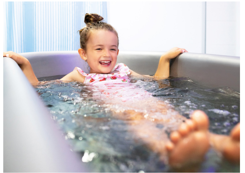
Uhličitě koupele mají děti ve velké oblibě

Co je tedy potřeba udělat, aby dítě mohlo využívat lázeňskou péči hrazenou zdravotní pojišťovnou? Rodič by se měl nejprve obrátit na praktického lékaře pro děti a dorost, který může vypsát na základě posouzení zdravotního stavu dítěte tzv. návrh na lázeňskou péči. Pomoci může zpráva od odborného lékaře, například alergologa či kožního specialisty, která je přiložena k návrhu. Tento návrh na lázeňskou péči má platnost 6 měsíců a průměrná doba na vyřízení se pohy-