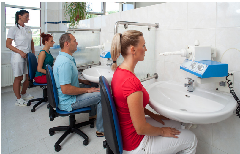
Inhalace je nepostradatelnou součástí postcovidové rehabilitace

„Důležité je zaměřit se na prevenci a nepodceňovat zdravotní problémy, které mohou v souvislosti s tímto onemocněním nastat. Regeneraci plic po prodělaní covidu-19 proto zbytečně neodkládejte. Včasný začátek rehabilitace dýchacího ústrojí dává naději na zlepšení výkonnosti až na úroveň před samotným onemocněním,“ upozorňuje P. Pšenica.