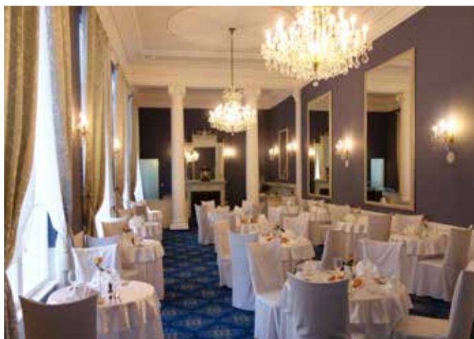
Modrá restaurace v jáchymovském hotelu Radium Palace