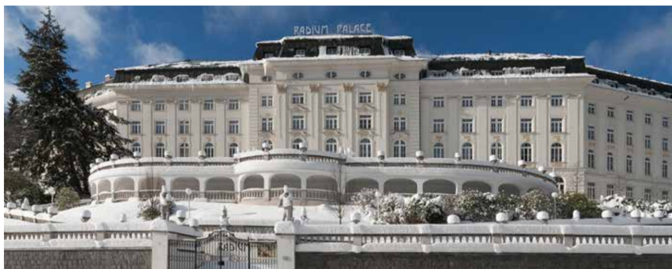
Pohádkově zasněžený hotel Radium Palace v Jáchymově