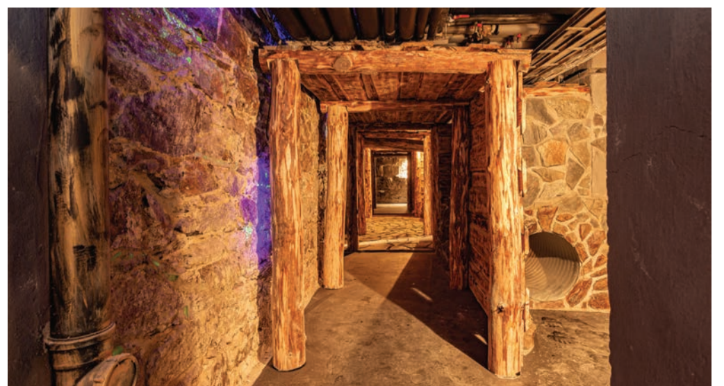
Prohlídková štola je věrnou kopií důlních chodeb dolu Svornost

Prohlídková štola je součástí návštěvnického infocentra, které všem ubytovaným pomáhá organizovat volný čas nabídkou výletů, tipů na zážitky nebo programovým servisem. Denním návštěvníkům zase poskytuje informace o lázních, jejich ubytovacích, stravovacích a relaxačních možnostech, ale také o radonu a jeho využití při léčení.