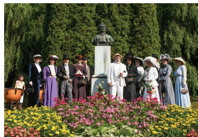
Festival je tradičně zahajován u busty L. Janáčka. Právě zde se uskuteční letošní symbolické Festivalové zastavení

9. ročník Festivalu Janáček a Luhačovice byl odložen na červenec 2022, ale jeho tradici, stejně jako osobnost Leoše Janáčka, si hosté připomenou v pátek 16. července v jednodenním programu zahrnujícím promítání filmového zpracování koncertu Janáčkovy Sinfonietty, komentovanou vycházku po stopách Leoše Janáčka, symbolický ceremoniál u skladatelovy busty a večerní koncert Janáčkovy komorního orchestru na Lázeňském náměstí.