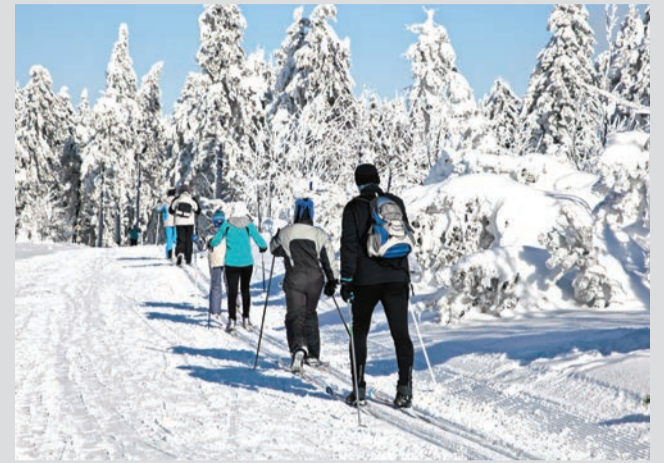
Krušnohorská běžecká magistrála

Pro vaši zimní dovolenou doporučujeme hotel Astoria, penzion Dagmar, pro nejnáročnější zmíněný Radium Palace a rodiny s dětmi ocení širokou nabídku apartmánového ubytování i servis dětského klubu Radonek.