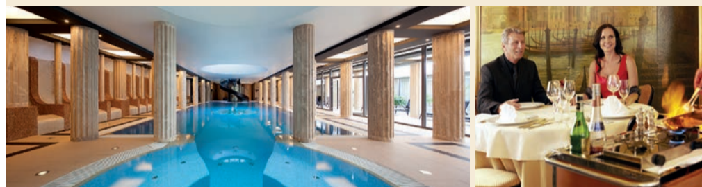
wellness centrum ve stylu starořímských lázní