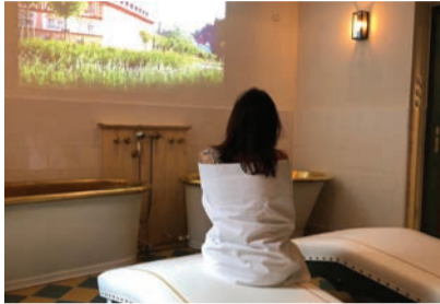
Zlaté vany v Jurkovičově domě

Zlaté vany však ožívají i v Jáchymově. Jedna je součástí výstavy o historii lázeňství v Aquacentru Agricola. Druhá slouží jako netradiční místo pro posezení v novém Inf. centru Léčebných lázní Jáchymov.