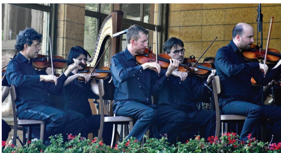
Zlínská Filharmonie Bohuslava Martinů zahájila luhačovické kulturní léto