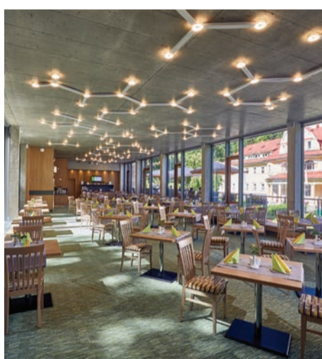
Restaurace U Vodopádu

Moderní stavba restaurace ze skla a betonu, která se před dvěma roky stala nepřehlédnutelnou dominantou středu lázní, ostře kontrastuje se secesní budovou hotelu Astoria. Její prosklené plochy zrcadlí přilehlý lázeňský park, jezírka i vodopád skrytý v jejím atriu a do interiéru pouští nejen světlo a okolní zeleň, ale i podhorskou atmosféru lázní. Jídelní lístek je postaven na principech jednoduché moderní gastronomie inspirované lokálními specialitami, které doplňují populární pokrmy domácí a mezinárodní kuchyně. Restauraci i obě její terasy mohou využít jak hoteloví hosté, tak návštěvníci Aquacentra Agricola, turisté i široká veřejnost. Pro nejmenší je připraven dětský koutek.