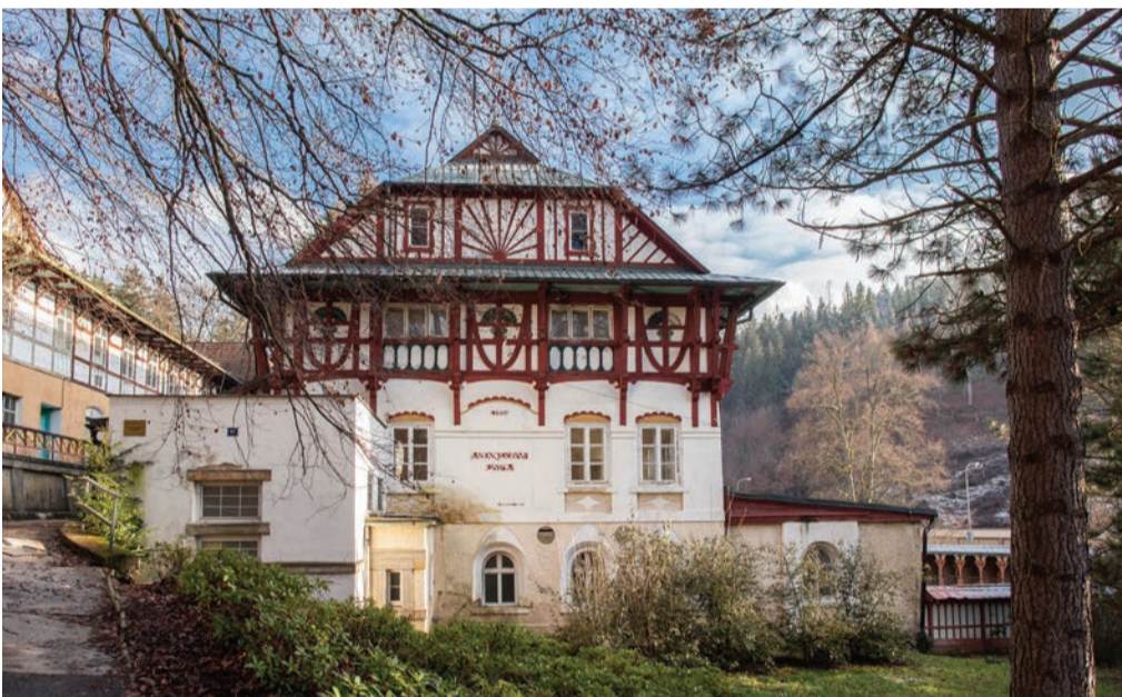
Celý areál Vodoléčebného ústavu bude po rekonstrukci další luhačovickou dominantou