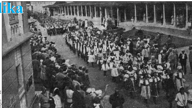
Ze župního sokolského sletu 25. a 26. července 1931

Od poloviny ročníku je součástí listu stránka s hádankami, doplňovačkami a křížovkami. Od 4. č. (30. 5.), kdy zahájila celou stranou, inzeruje firma Baťa (jež má v Luhačovicích svou prodejnu) pravidelně na stránkách zpravodaje svou produkci – Pod titulkem Letošní móda v lázních prezentuje názorně na 20 typů dámské a pánské obuvi pro všechny příležitosti v lázních (tj. vyobrazení, popis, cena) a k tomu dodává: Ke každému páru střevičků máme punčošky souladné barvy . S komerční nabídkou přispívá i ke společensko-výchovné etiketě. Redakční úvodník si pochvaluje tradici zpravodaje a doplňuje jej fotografie výpravy 40 posluchačů univerzity z Bukurešti, kteří lázně navštívili. Lázně přivítaly také 260členný zájezd Syndikátu čl. novinářů (23.-24. 5.), který zajel také do Vlčnova a zástupci položili kytici k hrobu Betty Smetanové . Exkurzi v lázních uspořádal také