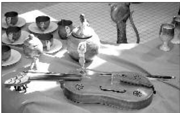
Sabina Bubentková, ročníková práce 2. ÚŘ