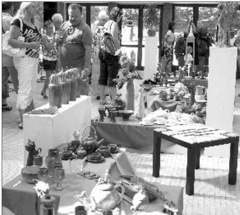
Výstava výrobků žáků oborů uměleckořemeslného zpracování SOŠ Luhačovice se setkává v hale Vincentky vředy s velkým zájmem

Největším překvapením je práce uměleckého kováře, tady ten roháč, který se vymyká dosavadním pracím uměleckých kovářů. Dřív to byly spíše technické věci a nyní máme poprvé takhle velký umělecký artefakt, který je poměrně náročný, jak po stránce